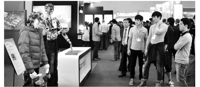
지난해 광주국제컨벤션센터에서 열린 국제광산업전시회에서 관람객들이 광산업 부스를 둘러보고 있다.