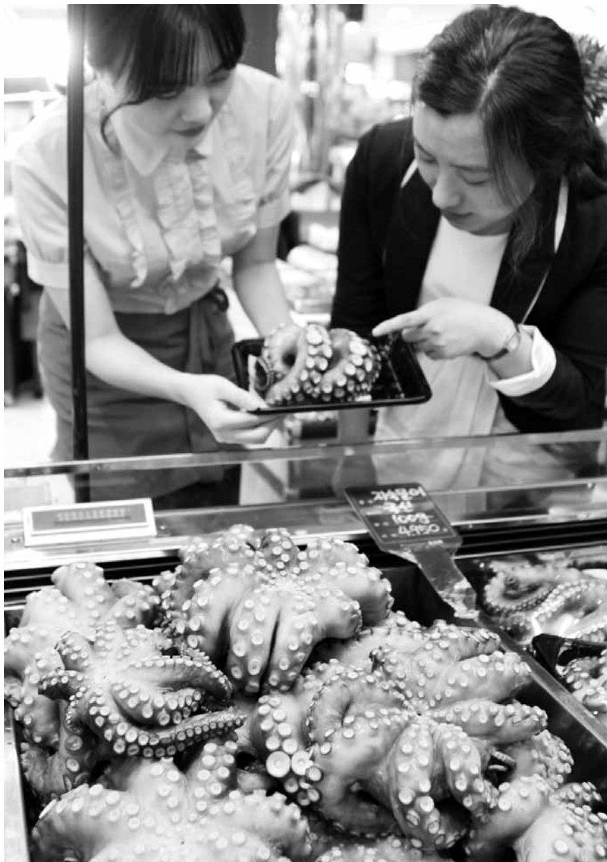
"보양식·피로회복에 좋은 문어 드세요"

초복(18일)을 앞두고 13일 백화점 식품 매장에 여름 보양식으로 뛰어난 문어가 선보였다. 문어는 다이어트는 물론 노화방지, 피로회복에 효과가 있고 두뇌발달에 효능이 있어 성장하는 아이들에게도 좋다고 알려져 있다. 100g에 4950원에 팔렸다.