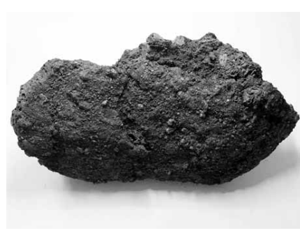
철 찌꺼기인 '노내재'.