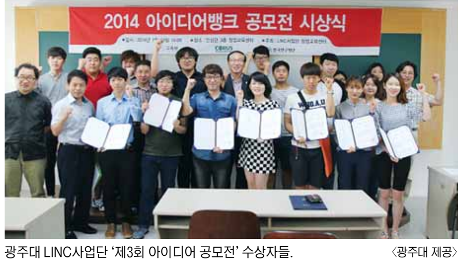
광주대 LINC사업단 '제3회 아이디어 공모전' 수상자들.

교육부가 전남도교육청에 전국교직원노동조합(전교조) 전임자 중 복귀하지 않은 4명에 대해 다음달 1일까지 직권면직하도록 요구했다. 전국적으로는 12개 시·도 32명이다. 교육부는 또 이들 시·도교육청에 직권면직 조치 결과를 다음달 4일까지 보고하도록 했다. 전교조 전임자를 8월25일까지 복직하도록 명령한 전북도교육감에 대해서는 국가공무원법에 위배되는 것으로 판단해 엄중 경고했다. /박정욱기자 jwpark@kwangju.co.kr