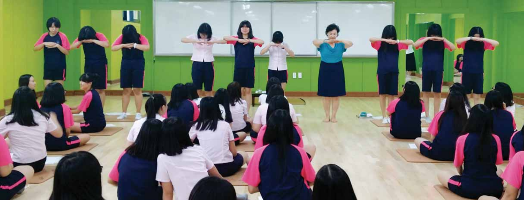
예쁘고 우아하게... 찾아가는 예절교육