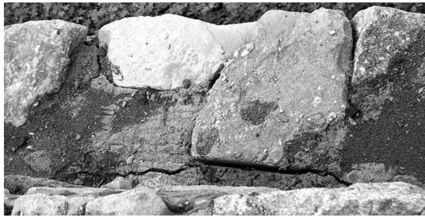
23일 나주시 불회사 인근의 유서깊은 암자인 일봉암 일대 옹벽이 심각하게 훼손된 채 방치되고 있다.

난 2011년 시·도비 예산 2억500만원을 들여 법당과 요사채 한 개 동을 준공했는데, 최근 암자를 받쳐주는 옹벽이 침하하고 있다"고 지적했다. 본보 확인결과, 옹벽 곳곳에 성인 주먹이 들어갈 만큼 틈이 벌어져 있어 암자 복원 3년 만에 붕괴할 우려를 낳고 있다. 특히 암자가 경사 심한 산기슭에 위치해 있고 벌어진 옹벽 사이로 산에서 흘러내리는 빗물이 들어가면서 붕괴를 재촉하는 등 긴급 안전진단이 필요한 상태다. 일봉암자는 불회사의 산내 암자로 원진국사가 불회사를 중창할 때 대웅전 상량식을 올리는데 시간이 부족해 뒷산에 올라가 기도하여 해를 멈추게 했다는 것이다.