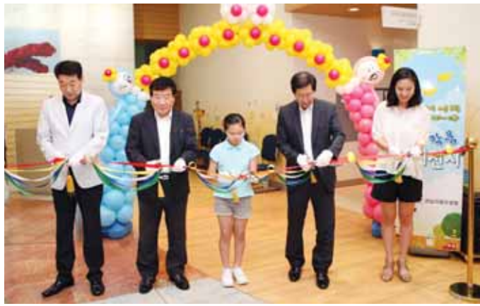
전남지방우정청(청장 문성계)은 최근 광주시립미술관에서 어린이 그림그리기 대회 수상자와 가족 100여명을 초청, '우체국과 함께 하는 Summer-Art 캠프'를 개최했다.