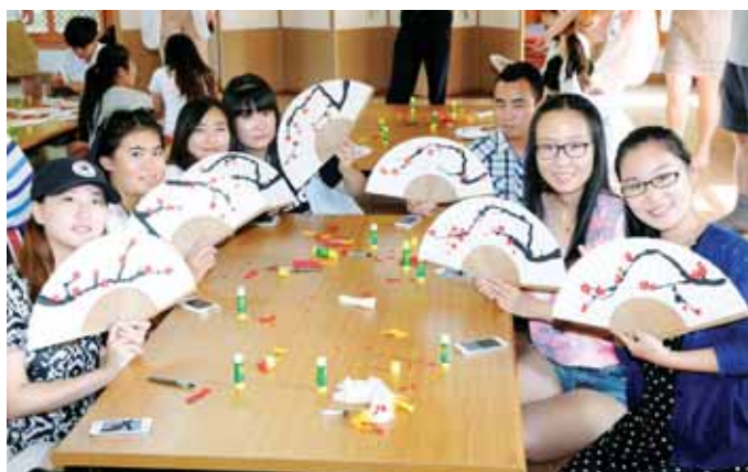
조선대학교에서 단기문화체험 프로그램에 참가하고 있는 중국 호북자동차공업대학교 학생들이 지난 29일 광주 동구 전통문화관에서 부채를 만들며 한국의 전통문화를 체험했다.