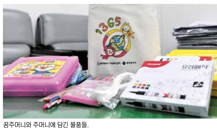
꿈주머니와 주머니에 담긴 물품들.

지켜본 정현오(올리브플레이스 대표)씨가 기부한 스케치북, 크레파스 등 학용품 400여 점과 아름다운가게 광주전남본부의 티셔츠 500장, 푸른광주21의 손수건 500장 등이다. 시는 지난 5일 아프리카아시아 난민교육후원회(ADRF)에 기부물품을 전달했다. 후원회는 오는 12월께 케냐 등 아프리카 어린이들에게 전달할 예정이다. ADRF는 ‘교육이 희망이다’라는 슬로건으로 아프리카와 아시아 등 11개 나라에 지부를 두고 교육 혜택을 받지 못하는 지구촌 저개발 국가 빈곤 아동들에게 희망의 교실을 지원하는 비영리 민간단체다. 채희종기자 chae@kwangju.co.kr