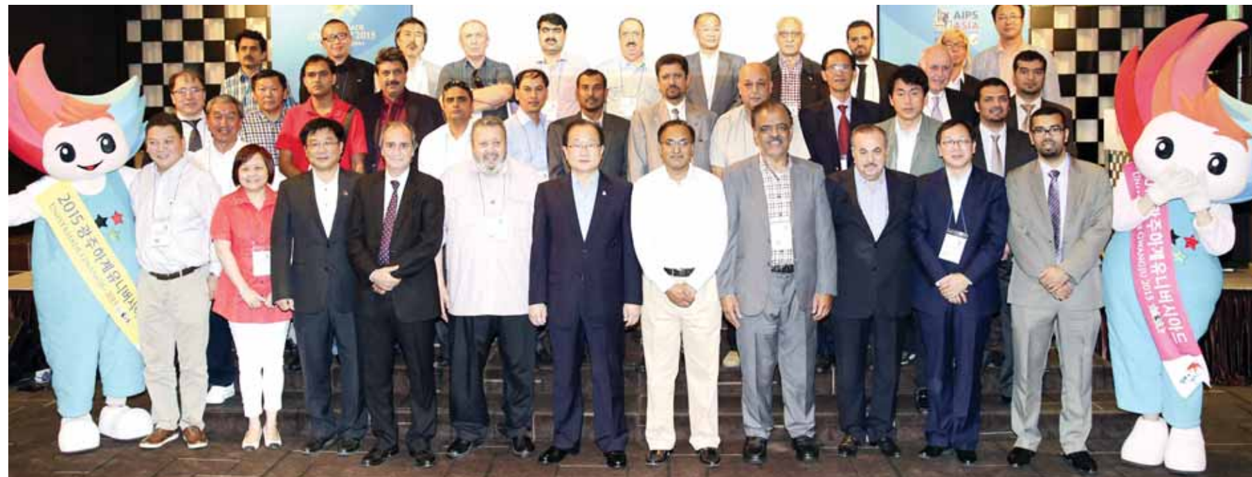
광주U대회 세계의 이목 집중시킨다. 2015광주세계유니버시아드대회 조직위원회는 지난 9월 서울에서 아시아체육기자연맹 회원 기자를 초청, ‘2015광주유니버시아드 리셉션’을 개최했다. 이날 행사에는 에사트 일마레트(왼쪽에서 네번째) 세계체육기자연맹 부회장, 파이살 알 카나이(다섯번째) 아시아체육기자연맹 회장 등 30여개국 대표 70여명이 참석했다. <광주U대회조직위 제공>

해에는 9월 15일부터 17일까지 3일간 김대중컨벤션센터에서 열린다. 기후변화특별관(산업관·체험관)과 환경기술관(수처리·대기·폐기물·토양 등)이 설치되면 국제환경산업포럼과 수출상담회 등 다양한 부대행사가 펼쳐진다. 특히 광주에서는 오는 9월부터 호남권 환경산업 일자리박람회와 국제관계배수위원회 광주총회, 물관리 심포지엄 등 다양한 환경 관련 국제행사가 열릴 예정이다. 김대중컨벤션센터 관계자는 “지난해 행사를 통해 관내 3개 기업이 케냐, 중국 기업과 3383만달러의 수출 협약을 체결하는 성과를 거뒀다”면서 “UFI 인증을 계기로 관내 업체의 해외 판로개척과 고용창출 증대 및 지역경제 활성화에도 기여할 것으로 기대된다”고 말했다. 채희종기자 chae@kwangju.co.kr