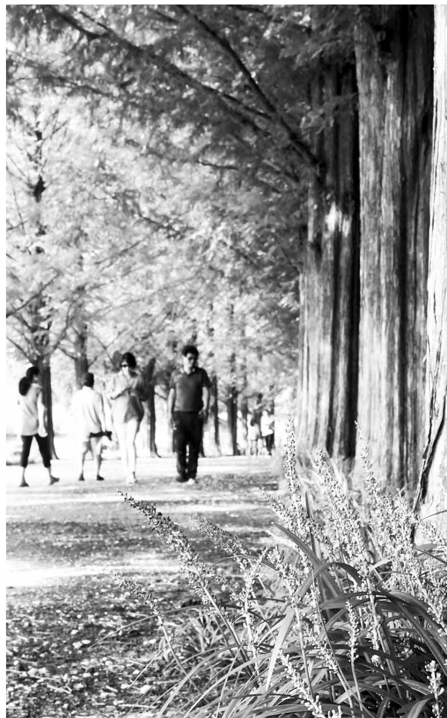
메타세쿼이아길에서 만난 맥문동 꽃