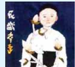
'뭇다 핀 꽃' 자수