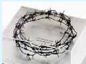
휴전선 철책 면류관