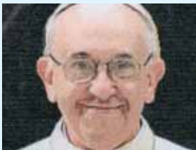
교황 초상화 자수