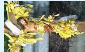
세월호 도보 순례단 십자가