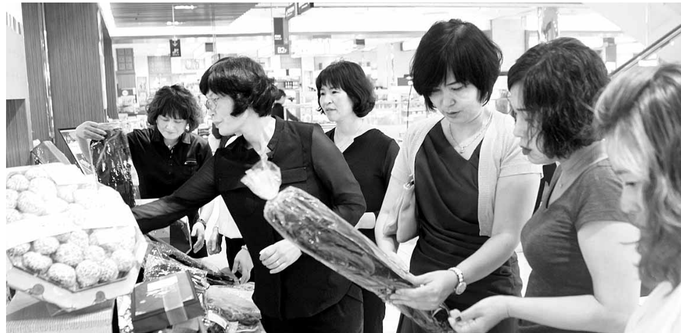
싱싱한 전남 특산물 드세요 18일 롯데백화점 광주점 지하 1층 특산물에서 열린 전라남도 특산물 소비촉진 특별전에서 고객들이 진도 미역과 멸치, 완도산 전복 등을 고르고 있다. 이번 특별전 행사는 9월6일까지 계속되며 돌김, 김치, 젓갈류 등 120여종의 지역 특산물이 선보인다.

기아자동차 노조가 올해 임금단체교섭 결렬에 따른 첫 파업에 들어갈 것으로 알려졌다. 18일 금속노조 기아차지부(기아차 노조)에 따르면 노조는 이날 구성된 쟁의대책위원회 회의를 통해 오는 22일 광주공장 등 3개 공장에서 2시간 총량제 부분파업 실시에 의견을 모은 것으로 전해졌다. 이에 따라 광주지회는 22일 주간1조와 2조가 각 2시간씩 부분파업을 실시할 예정이다. 기아차 노조 관계자는 “사측과의 교섭은 꾸준히 진행하되 결렬이 나지 않을 경우, 처음 투쟁의 수위를 높여갈 것”이라고 밝혔다. /임동률기자exian@kwangju.co.kr