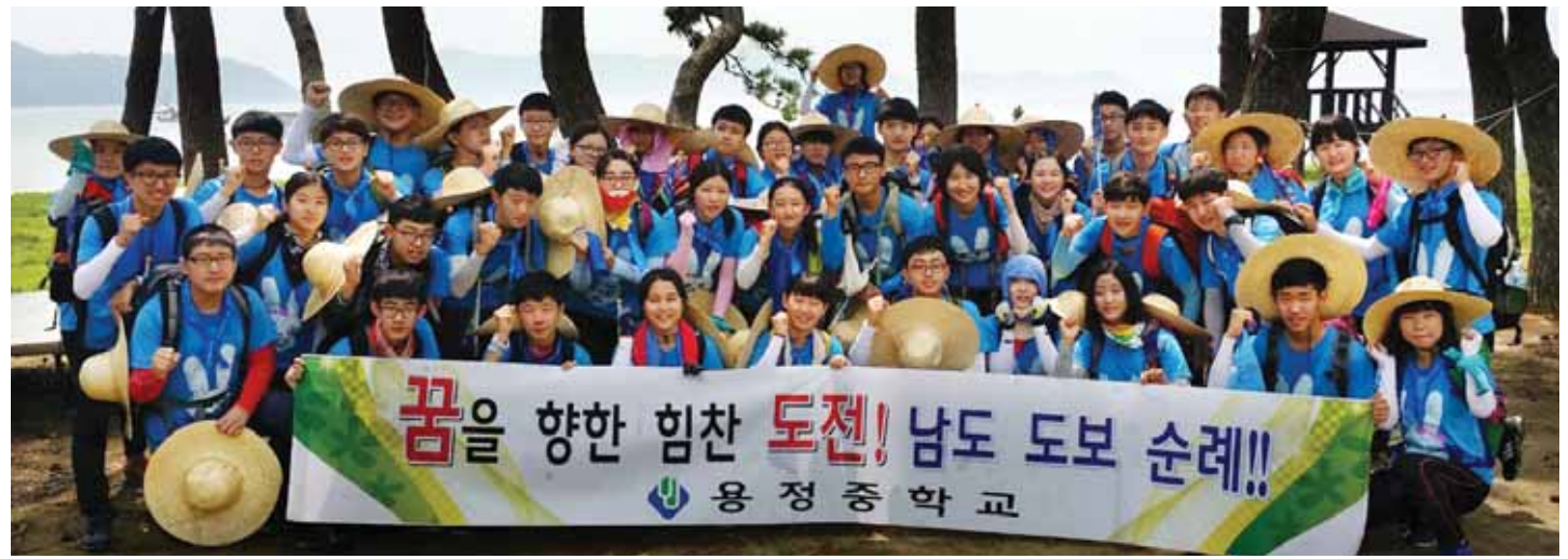
지난 26일 남도 도보순례를 떠난 보성 용정중학교 학생들이 해남 사구미 해수욕장에서 환경정화활동 뒤 기념촬영을 하고 있다.

학생들은 숙소에 도착하면 도보순례기간 중 무엇을 위해 걷고 있으며 행사를 마친 후 어떤 일을 하고 싶은 지에 대해 자유롭게 토론하게 된다. 이들은 자신을 위한 목표 이외에도 부모님과 사회를 위해 할 수 있는 역할을