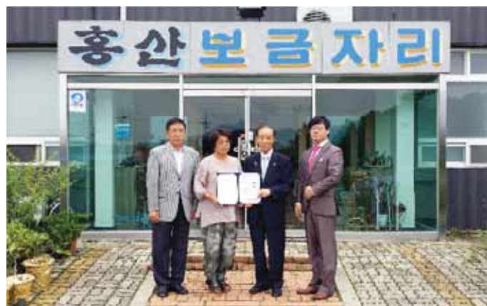
안국산업(주) 곡성휴게소·주유소, 남원휴게소(대표 김성수)는 최근 곡성경면·남원주생면·곡성흥산보금자리·담양예수마을에집을 방문, 불우이웃성금 600만원을 전달했다.