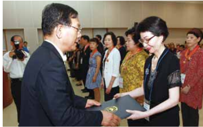
광주시·전남도 교육청은 28일 초·중등 교육공무원과 사립교원 562명(광주 164명·전남 398명)에게 훈·포장 전수와 퇴임식을 했다. 사진은 전남도교육청 훈·포장 전수식.