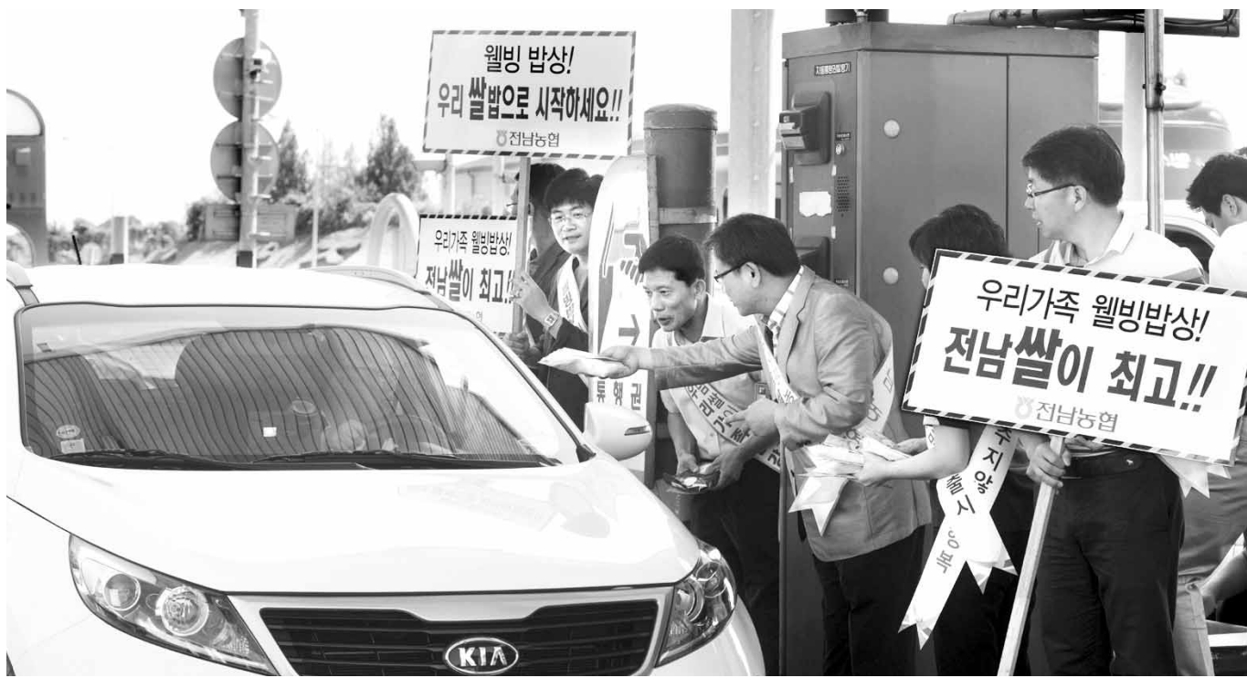
웰빙밥상 전남쌀로 시작하세요

통상 추석과 설 등 명절 직후에는 일시적인 '소비 소강상태'가 나타난다. 이런 상황에서 출하량이 늘어나면 가격이 떨어지는데, 올해는 햇과일이 나오기 시작하는 시기에 추석이 끼어 이후 가격 하락폭이 예년보다 클 것이라는 게 업계의 관측이다. /연합뉴스