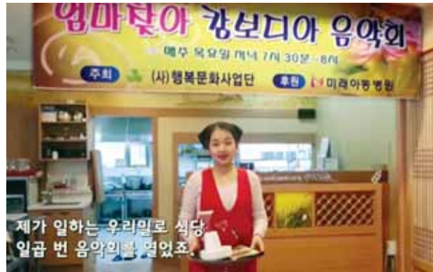
유튜브 갈무리 화면.