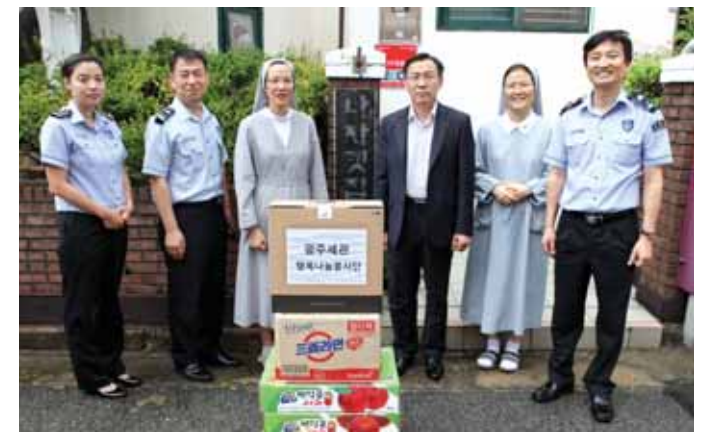
광주본부세관 행복나눔봉사단원들은 최근 추석을 앞두고 ‘광주나자릿집’과 소년가장 그룹을 ‘길상원’을 찾아 학습용 노트북 컴퓨터와 생활용품품을 전달했다.