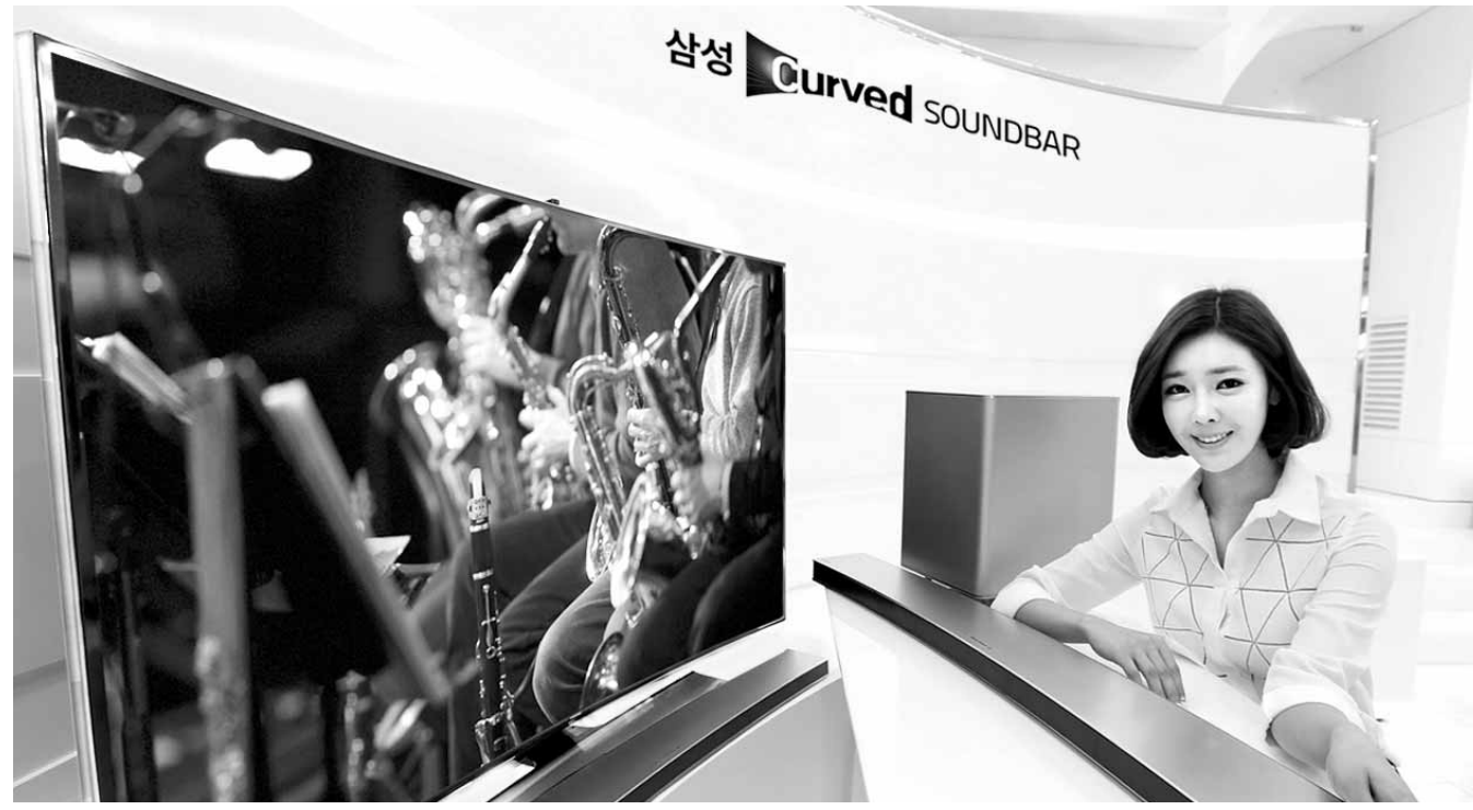
삼성전자, TV 매칭 오디오 ‘커브드 사운드바’ 출시

금호타이어는 기업신용등급이 상향 조정돼 자금 조달과 대내외의 신인도 향상 및 기업이미지 개선 등의 긍정적 효과가 발생할 것으로 내다봤다. /임동률기자 exian@