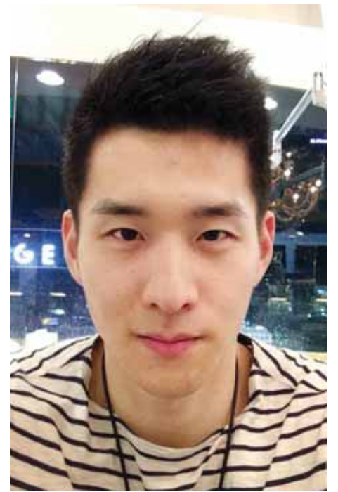
도울 수 있다는 사실이 즐거웠고, 뭔가 나눌 수 있음을 감성하게 생각했습니다. 제 한 몸을 위해 취업하려고 발버둥칠 때는 이렇게 즐겁지 않았습니. 제가 선택한 길이 힘들지만 제가 하고 싶었던 일기에 꼭 이루고 싶습니다.

“구호식품을 만들어 배고픈 이들을 돕고 싶다는 생각을 한 이후 사는 이유가 분명해졌습니다. 어릴 적부터 제 작은 힘이라도 남을