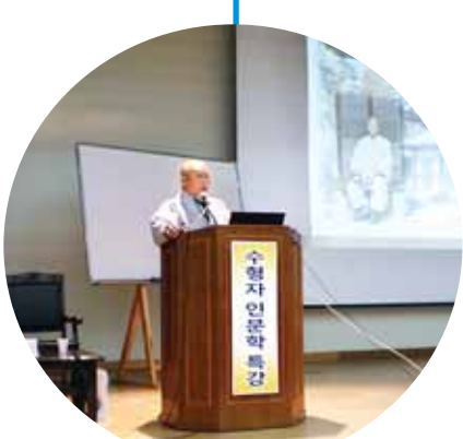
<퇴짜자 스님의 인문학 강의>

◇다양한 교육 프로그램 호응=인문학과 교도소의 만남은 효과적이었다. 순천교도소는 다양한 인문학교육을 통해 수형자의 안정적인 사회 정착을 돕고 있다. 문학, 역사, 철학, 문화, 예술 등 다양한 분야의 강의를 진행되고 있으며 수형자들의 관심도 뜨겁다.