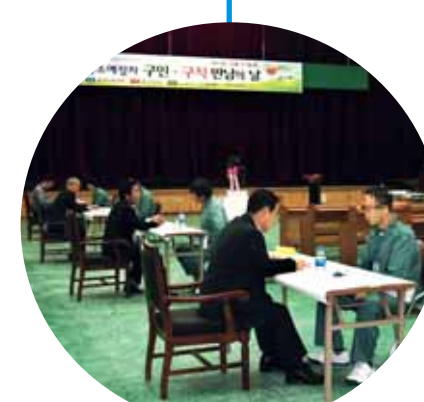
<구인구직 만남의 날>

교도관과 자원봉사자 등 전문가를 중심으로 형기 종료나 가석방을 앞둔 수형자들을 위한 교육을 진행하고 있다. 취업, 창업 성공사례와 변화된 사회환경 설명, 생활법률, 법률구조, 국민기초생활보장제도 등 사회구성원으로서 어려움을 겪지 않도록