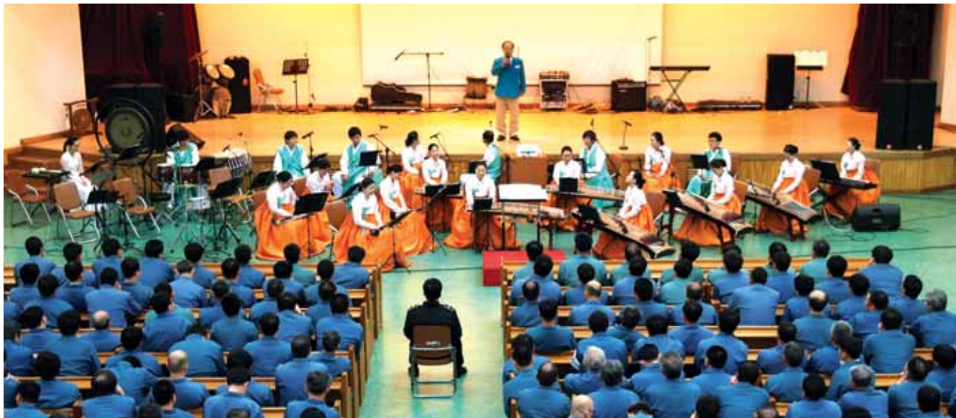
순천교도소는문학·철학·예술 등 다양한 인문학 강좌와 인성교육 등 체계적인 수형자 교육 프로그램을 실시하고 있다. 사진은 여수 시립국악원의 찾아가는 음악회.