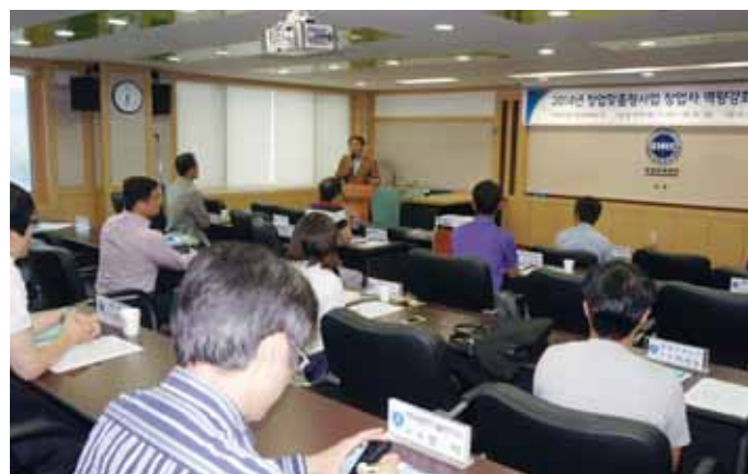
동강대학교 창업보육센터는 최근 대학 산학협력관 교육실에서 2014년 창업맞춤형사업 선정기업이 참가한 가운데 '창업자 역량 강화를 위한 의무교육' 수료식을 가졌다.