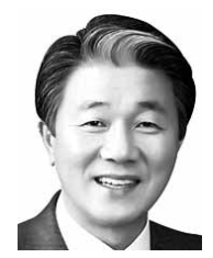
까지 상임위원회 활동으로 주요업무 추진상황 정취 및 조례안 등 안건심사를 마친 후, 31일 제2차 본회의에서 조례안 등 안건을 처리하고 폐회할 예정이다. /정읍=박기섭기자 parkks@