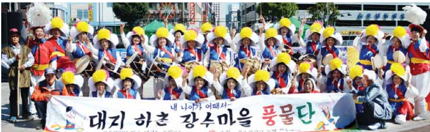
일흔 안팎의 회원들로 구성된 광주 남구 대지하촌마을 품물단이 최근 첫 출전한 대회에서 2등이라는 성과를 냈다.

대지하촌 마을은 지난 2013년 광주시 농업기술센터 농촌건강 장수마을공모사업에 선정됐다. 이후 건강사회참여·교육·소득·환경 개선사업까지 네 개 분야 사업을 시작했다.