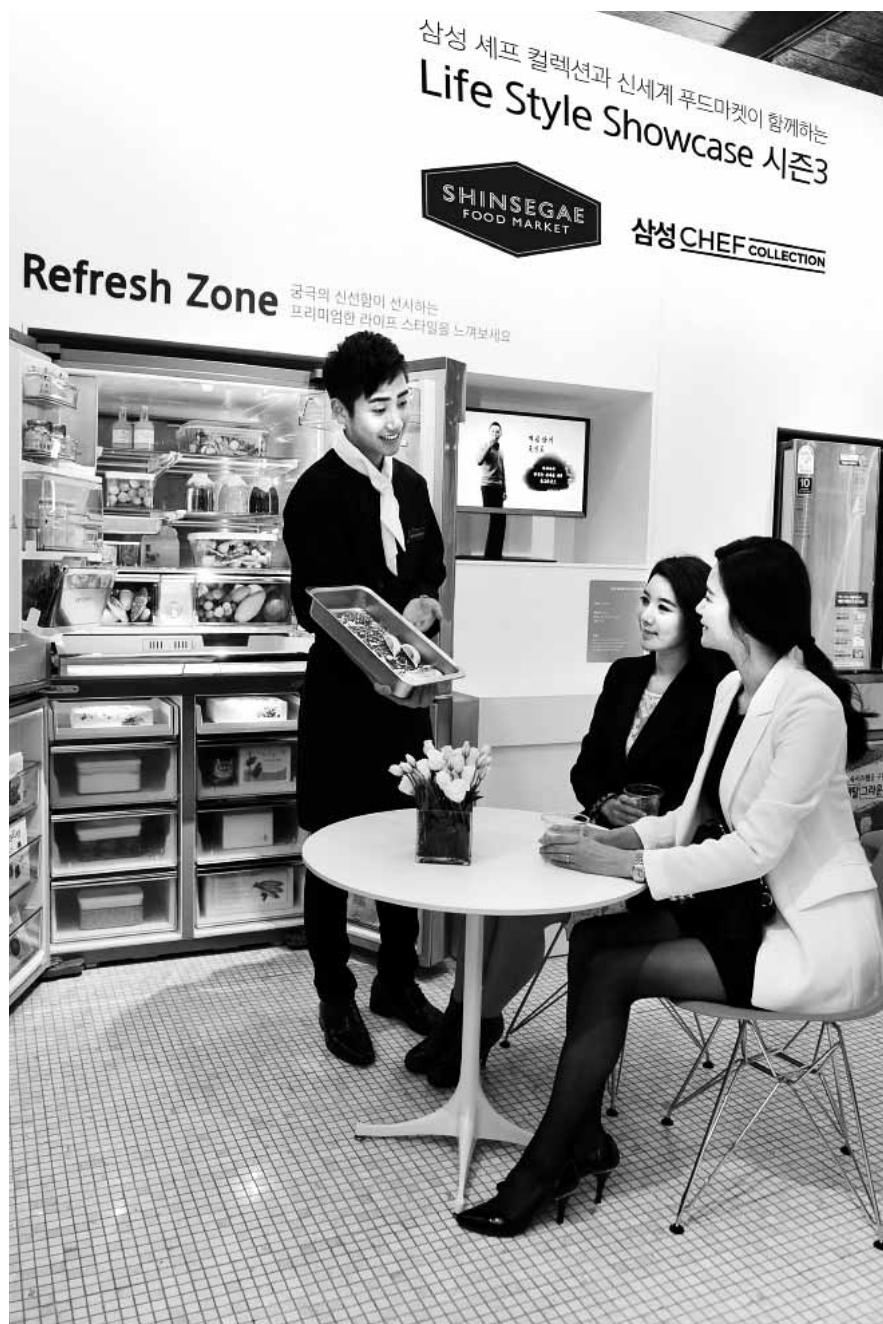
‘라이프 스타일 쇼케이스’ 행사 22일 서울 신세계 백화점에서 열린 ‘삼성세프 컬렉션과 신세계 푸드마켓이 함께하는 Life Style Showcase 시즌3’ 행사에서 고객들이 식재료 관리법 등을 배우고 있다.

9월중 신설법인 수는 407개로 전달(430개)보다 23개 줄어든 것으로 조사됐다. /김대성기자 bigkim@kwangju.co.kr