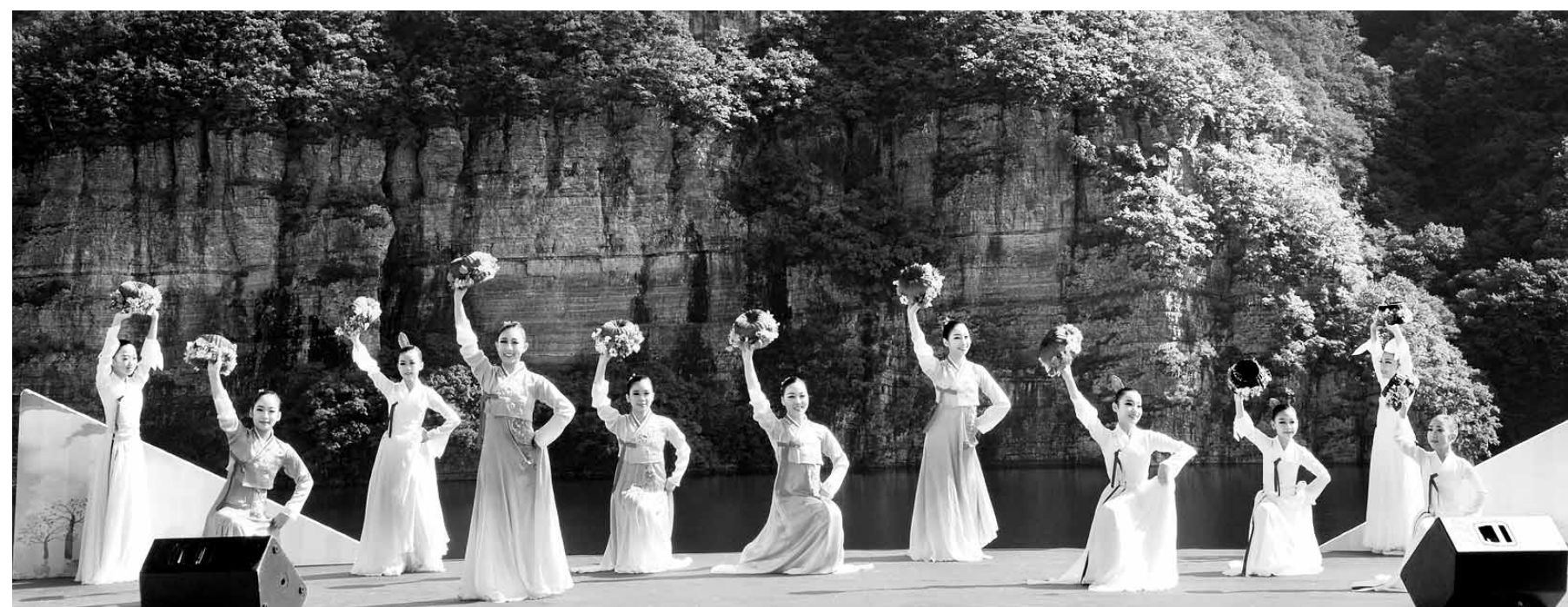
23일 오전 화순군 이서면 망향정에서 열린 '이서적벽' 개방식 및 제29회 적벽 문화제에서 적벽을 배경으로 문화 행사가 펼쳐지고 있다.

학술지인 '네이처'에 이날자로 실렸다. 데이노케이루스는 1965년 폴란드팀이 몽골 고비사막에서 앞발 화석을 찾으면서 존재가 알려졌지만, 추가 정보가 발굴되지 않아 '미스터리 공룡'으로 남아있었다. 데이노케이루스라는 학명은 '무서운 발톱'이라는 뜻에서 지어졌다. 연구팀은 화성시가 지원한 '한국-몽골 국제공룡탐사' 프로젝트를 통해 2006년과 2009년 몽골 남부고비사막에서 데이노케이루스 몸통뼈 표본을 발굴했다. 당시 표본 중 머리뼈와 발뼈는 도굴된 상태였는데, 연구팀은 유럽의 한 개인이 도굴된 뼈들을 소장하고 있다는 것을 확인하고 소유자에게 몽골에 반환할 것을 지속적으로 설득했다. 이에 지난 5월 1일 데이노케이루스의 머리뼈와 발뼈가 몽골로 반환됨에 따라 데이노케이루스의 완전한 복원도를 구현해낼 수 있었다고 설명했다. /연합뉴스