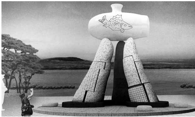
무안군 일로읍 청호리에 만들어진 주룡나루터 조형물(왼쪽)과 몽탄면 몽강리에 조성하는 석정포 조형물 조감도.