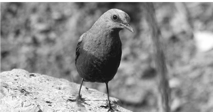
바다직박구리는 바닷가 인근에 서식하는 흔한 텃새로 알려졌지만 이번 연구 결과, 일부는 국제적으로 이동 한다는 것이 확인됐다.

연구용으로 새에 가락지를 부착하는 것은 철새의 국제적 이동경로를 확인하 는 기본적인 조사방법이다. 공단은 2004 년 이후 지금까지 4만6000여 마