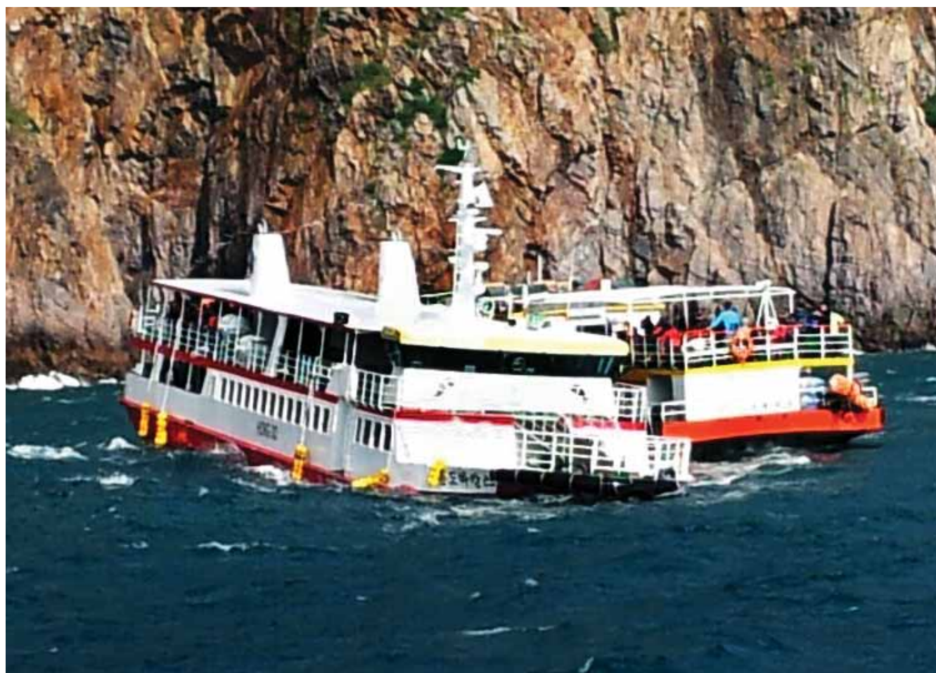
지난 9월 좌초 사고를 당한 흥도 유람선.

라 인·허가 및 안전 관리를 책임지는 유람선 36척 중 흑산도를 운항하는 유람선은 지난 1979년에 건조됐고 지난 9월 좌초 사고 가 난 흥도 바깥스호는 지난 1987년 만들어진 낡은 배였다. 여수 해경이 관리하는 유람선 24척 중 11척이 20년이 넘는 오래된 선박이다.