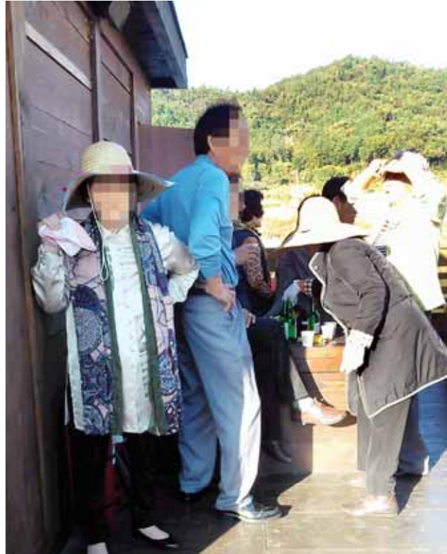
지난달 나주시 영산포 일대를 운행하는 유람선 왕건호에서 음주를 하고 있는 승객들.

불안한 광주·전남 바꾸자 안전지대로 <5> 세월호 겪고도... 여전히 불안한 뱃길