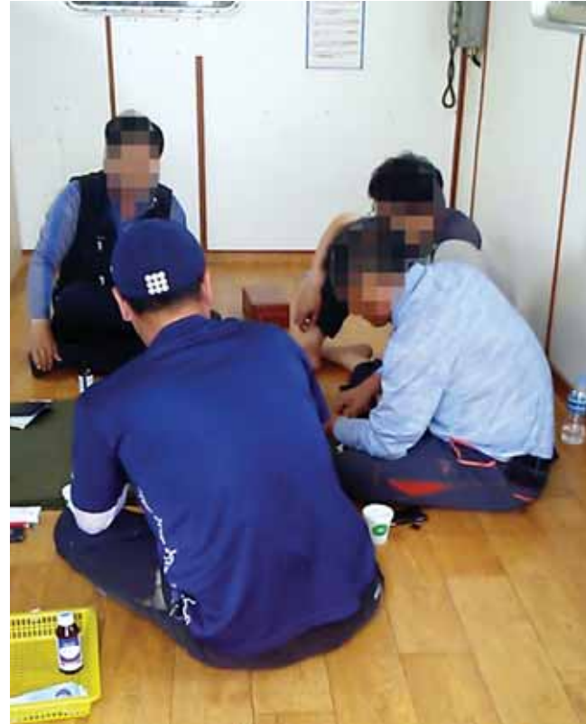
세월호 침몰 참사 뒤 2개월이 지난 6월 탑승했던 목포~신안 비금도 간 여객선에서 승무원들이 운항 중 화투를 치고 있다.