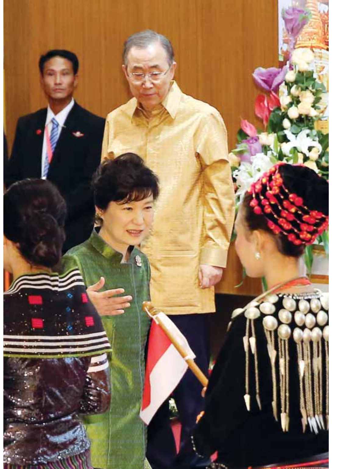
박대통령, ‘대명론’ 반총장과 조우 제9차 동아시아정상회의(EAS) 및 제17차 아세안(ASEAN)+3(한·중·일) 정상회의 참석차 미얀마를 방문 중인 박근혜 대통령이 12일(현지시간) 최근 차기 대권주자로 급부상한 반기문 유엔 사무총장과 조우했다. 박 대통령과 반 총장이 네팔도 국제회의센터에서 열리는 갈라 만찬에 앞서 기념촬영을 하기 위해 입장하고 있다.