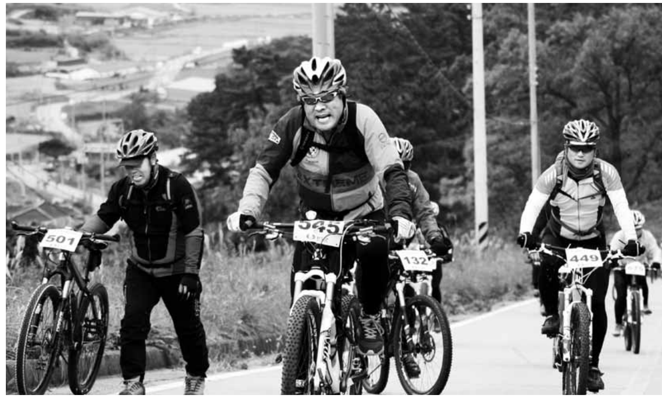
장보고배 전국 산악자전거대회 지난 16일 완도군 상황봉(해발 644m) 일원에서 열린 '제4회 장보고배 전국 산악자전거대회'에 참가한 선수들이 힘차게 페달을 밟고 있다. 완도 공설운동장에서 출발해 완도 수목원과 상황봉 주코스를 완주하는 39km 크로스컨트리 종목으로 치러진 이번 대회에서 경상남도연합회가 클럽대학 단체전 종합우승을 차지했다.