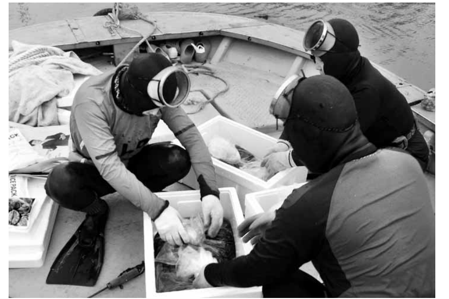
해녀들이 최근 해남군 북평면 남성리 앞바다 해저갯벌에 어린 해삼종묘를 뿌리기 위해 입수준비를 하고 있다.