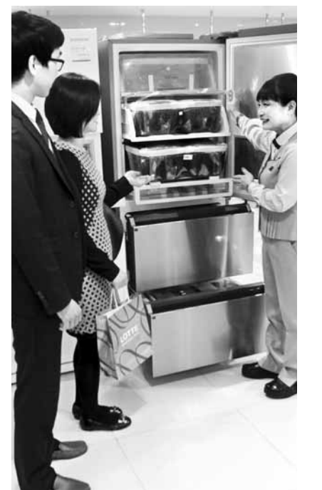
19일 백화점 가전매장에서 고객이 점원에게 김치냉장고에 대해 설명 듣고 있다.

업계에서는 올해가 10년에 한번 꼴로 찾아오는 김치냉장고 교체 주기와 맞물린 점도 매출 신장에 영향을 미쳤다고 분석하고 있다.