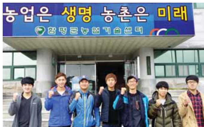
광주·전남지방병무청(청장 문병민)은 지난 18일부터 28일까지 나주시 등 8개군 농업분야(후계농업경영인) 산업기능요원을 대상으로 찾아가는 복무자 교육을 실시했다.