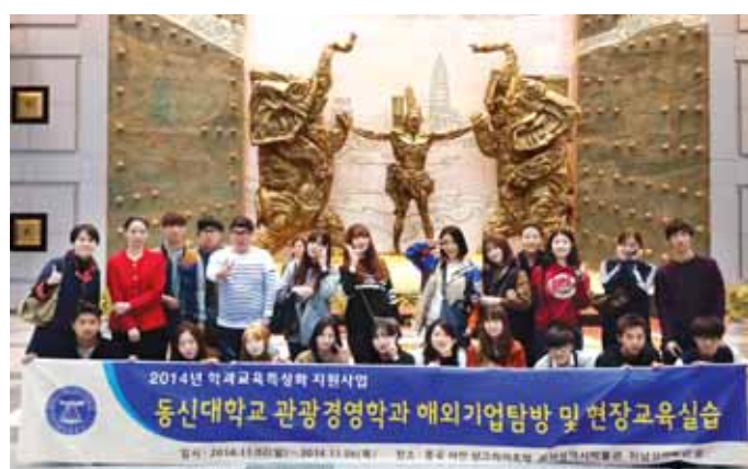
동신대학교 관광경영학과(학과장 송경웅)가 재학생들의 글로벌 역량 강화를 위해 중국 역사도시인 서안, 정주 지역 해외기업 탐방 및 현장교육실습을 실시했다.