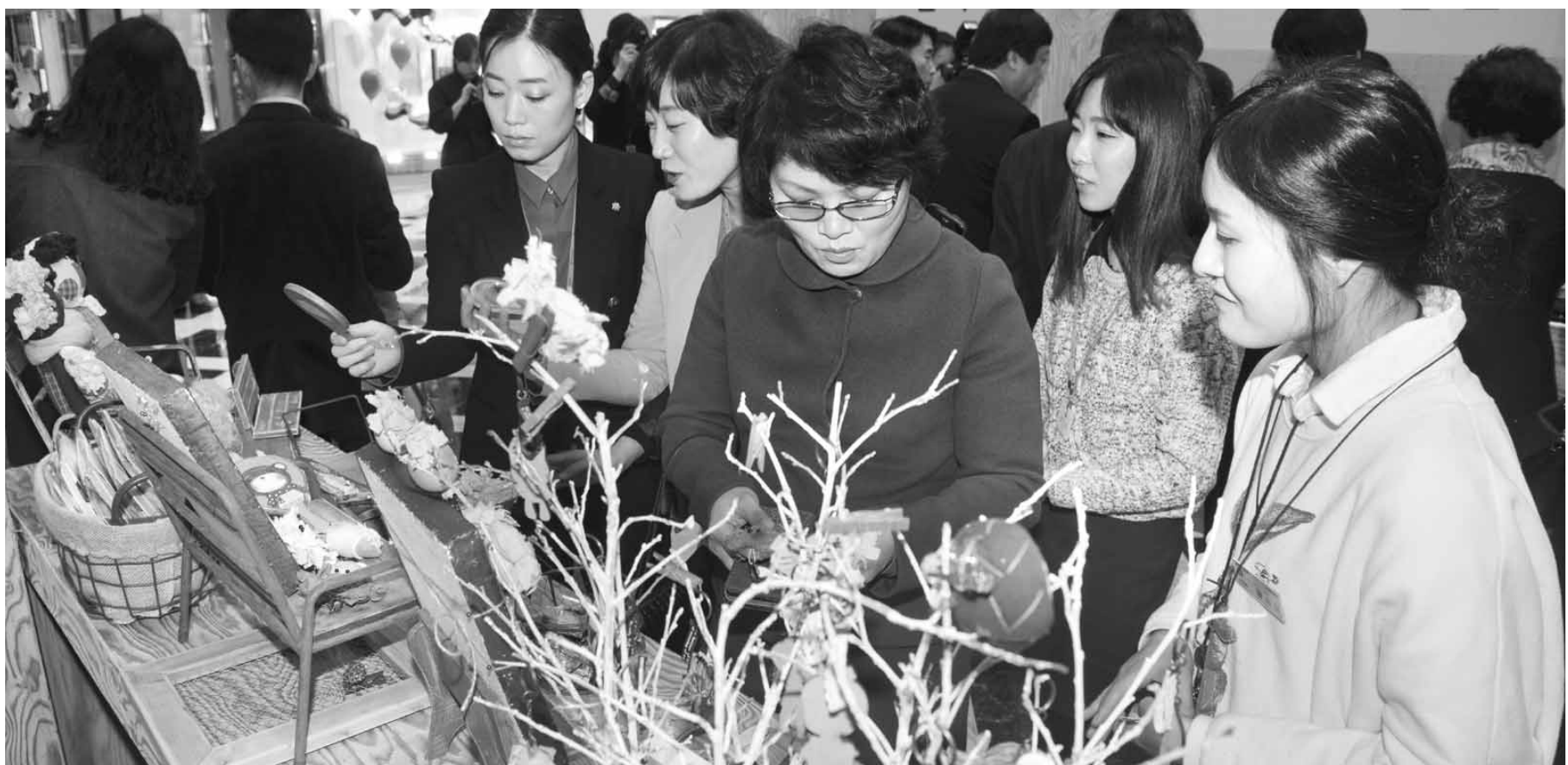
27일 광주신세계 백화점을 찾은 고객들이 '2014 광주 우수 수공예품 홍보 기획전'에 전시된 작품을 살펴보고 있다. 광주시가 주최하고 광주디자인센터와 광주공예협동조합이 협력한 이번 기획전은 내달 3일까지 열린다.