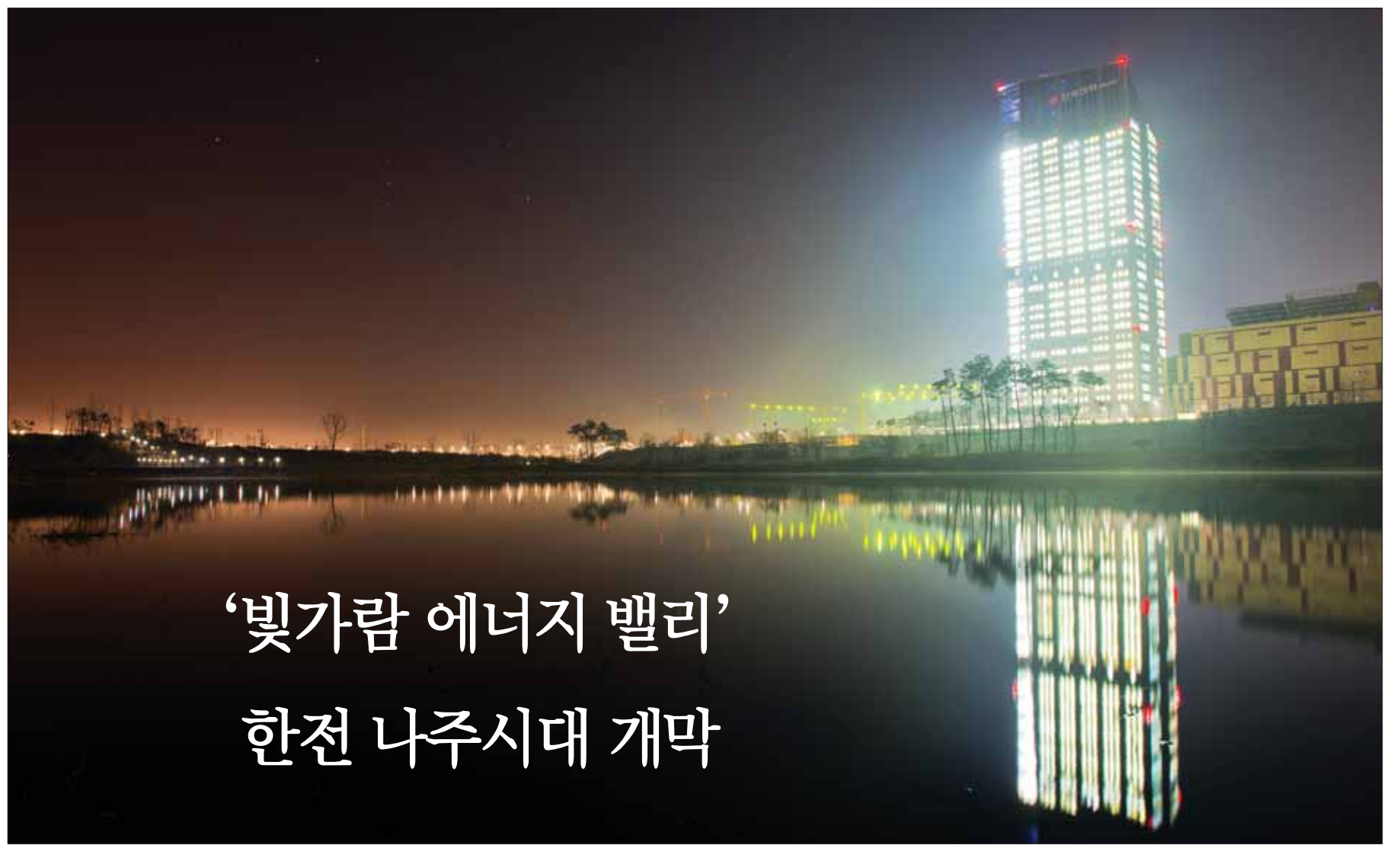
1일부터 본격적인 '나주 시대'를 열게 되는 광주·전남공동혁신도시의 한국전력 본사 신사옥이 지난 30일 오후 환하게 빛을 밝히고 있다.