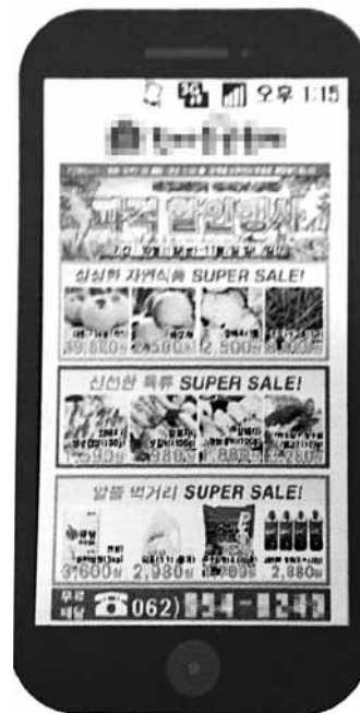
거림의 MMS 광고 서비스