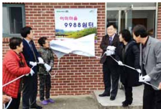
독거노인을 위한 '9988씬터' 개소식.

에 대한 소중함을 일깨워 준 공로로 '대한민국 무궁화대상'을 수상하기도 했다.