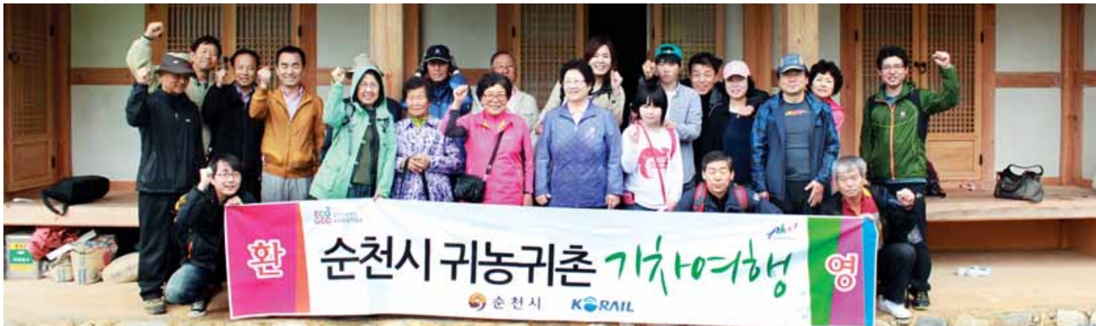
순천시와 코레일이 공동으로 지난해부터 귀농·귀촌 희망자들을 대상으로 농업·농촌체험 및 귀농·귀촌 토크콘서트, 귀농 선배와의 대화 등을 통해 귀농에 필요한 전문적인 지식을 접할 수 있는 '귀농·귀촌 기차여행' 상품을 마련, 호응을 얻고 있다. 순천을 찾은 수도권 귀농·귀촌 희망자들.