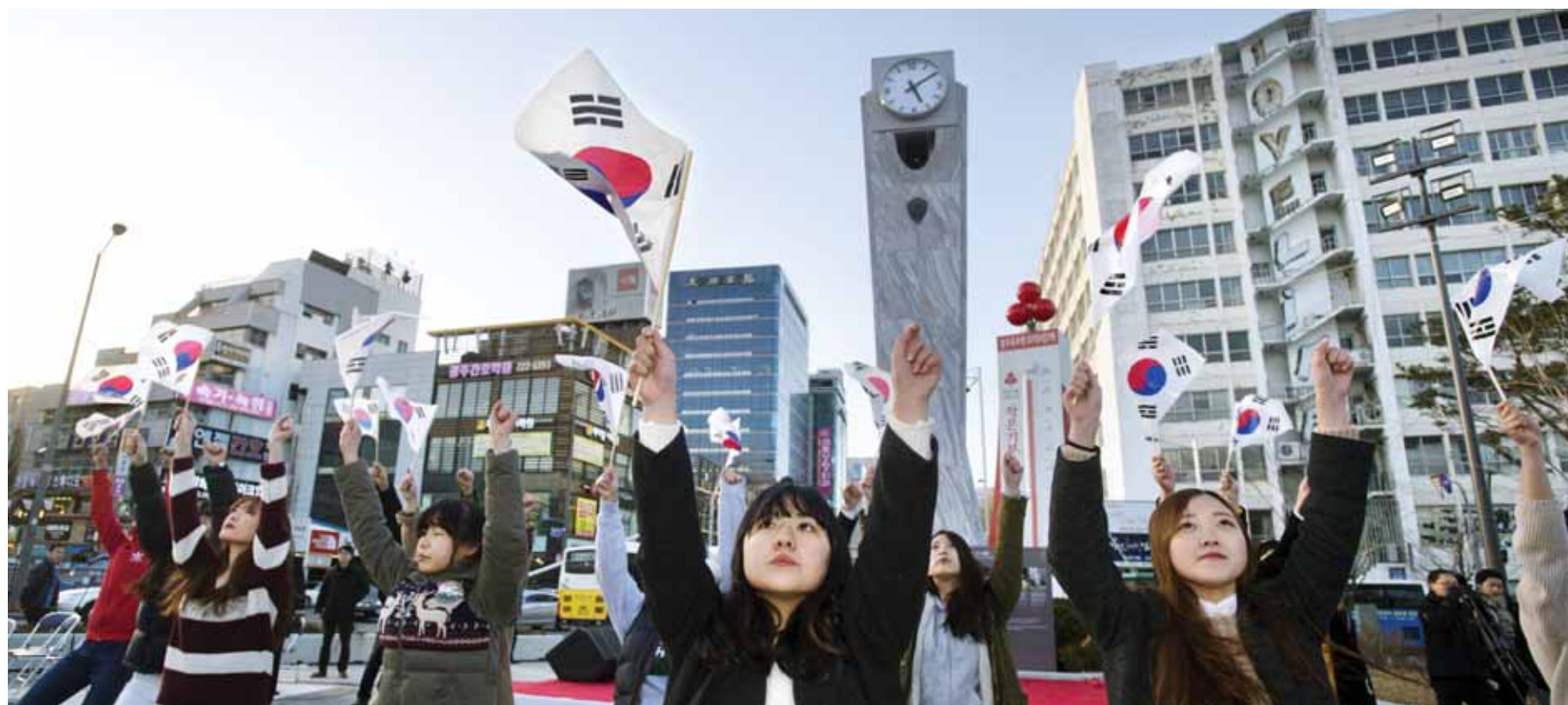
옛 전남도청 시계탑 복원 27일 광주시 동구 옛 전남도청 앞 광장에서 열린 5·18 시계탑 제막식에 참가한 청소년들이 '임을 위한 행진곡'에 맞춰 울음을 선보이고 있다. 지난 1971년 제작된 이 시계탑은 80년 5월 광주의 비극을 지켜본 뒤 80년대 중반 군사정권에 의해 농성광장으로 옮겨졌었다.