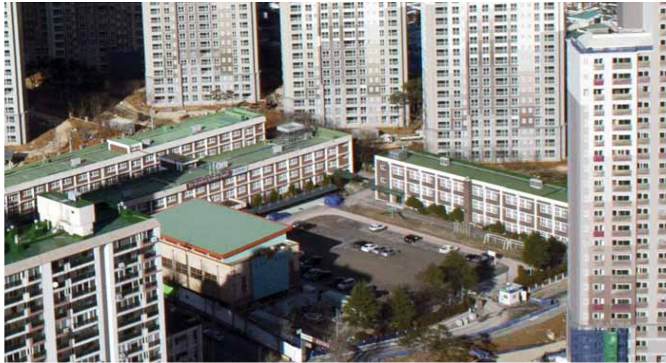
광주시 서구 화정동 유니버시아드 선수촌에 둘러 쌓인 주월초등학교 전경.

4일 광주시교육청과 주월초 학부모들에 따르면 광주시 서구 화정동 유니버시아드 선수촌에 둘러 쌓인 주월초등학교 전경.