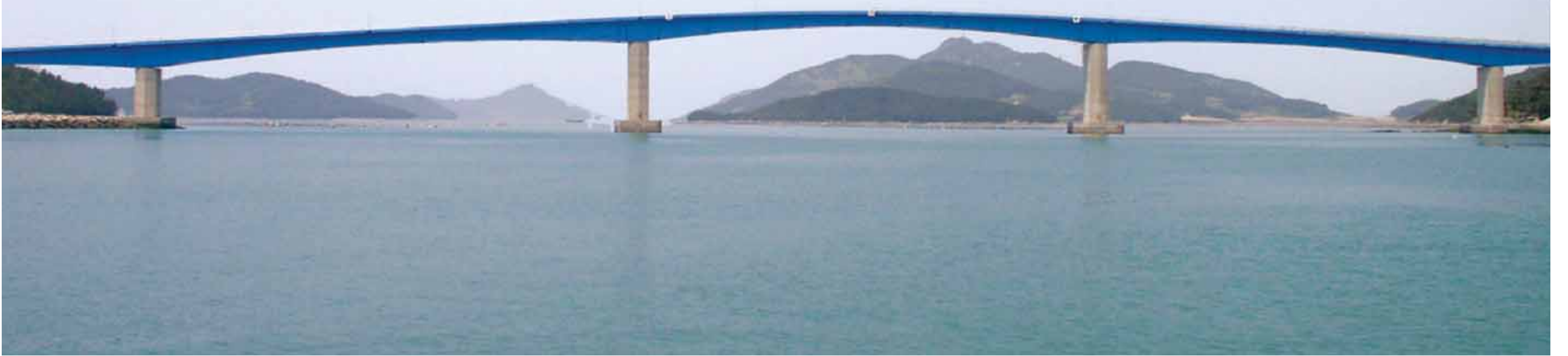
1997년 4월30일 준공된 조도대교는 진도의 상·하조도를 잇는 다리로 연장 120m 3개, 75m 2개 등 강철 박스(Steel Box)를 잇는 방식으로 축조돼 기능은 물론 아름다움에서도 뛰어나다는 평가를 받고 있다.