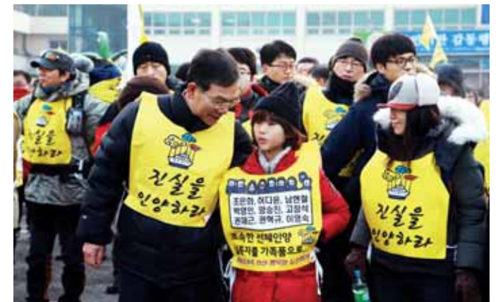
장만채 전남도교육감은 11일 세월호 참사 300일을 맞아 세월호 유족 등과 함께 온전한 세월호 인양과 진상규명을 요구하며 무안군 청에서 청계북초등학교까지 도보행진을 했다.