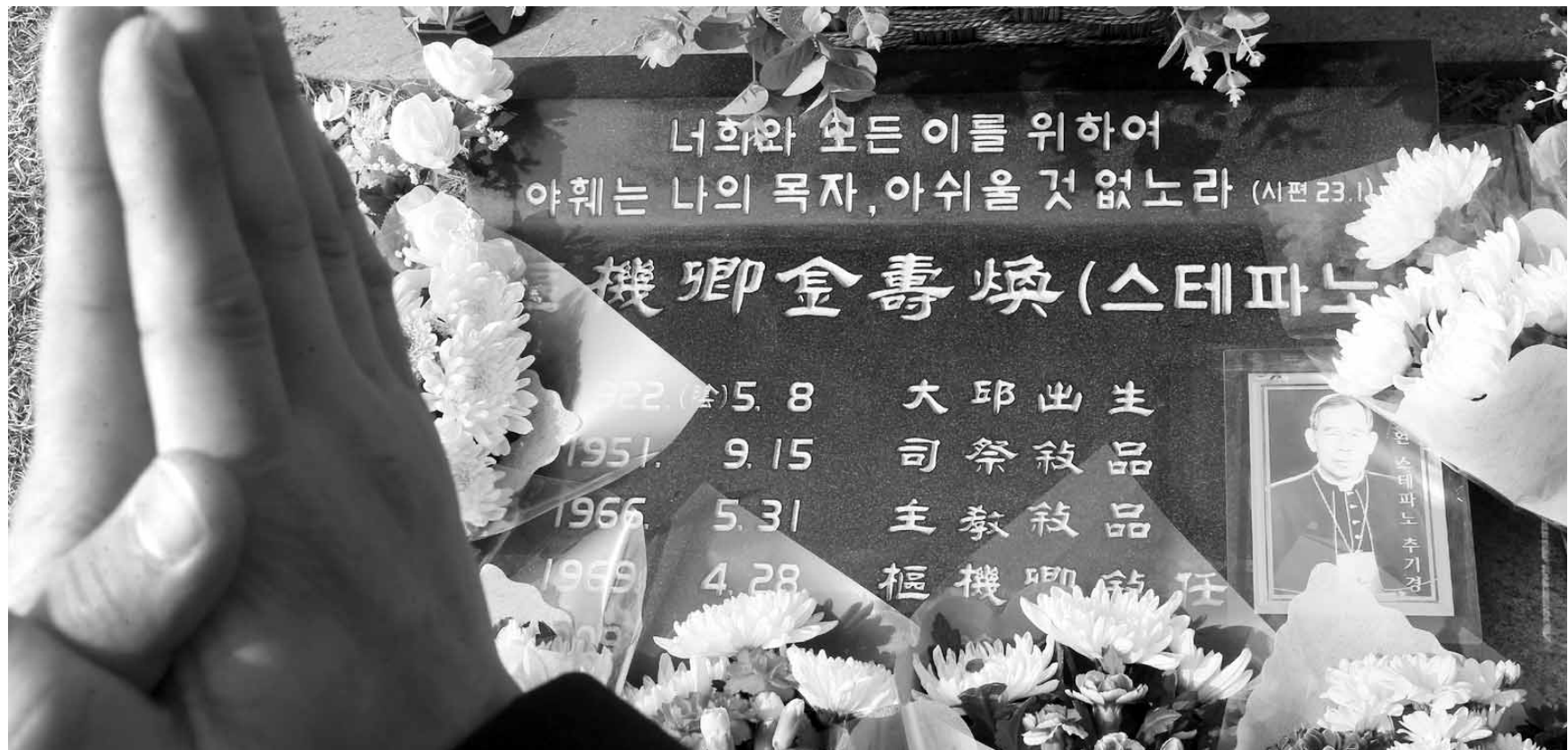
김수환 추기경 6주기를 하루 앞둔 15일 오후 경기도 용인 천주교공원묘지를 찾은 한 추모객이 김 추기경의 잠든 묘소 앞에서 기도하고 있다.

로)을 설치해 이용자들의 편의와 교통사고 예방에 큰 기여를 하게 됐다. 또 이번 개통으로 화순읍과 남평읍, 광주대학교, 도곡은전단지, 주변 골프장이 용과 연결이 손쉽게 돼 지역경제 활성화에도 큰 도움이 예상된다. 최보현 전남도 도로교통과장은 "이번 조기 개통으로 지역 주민들과 관광객의 접근이 용이해지게 됐다"며 "앞으로 미개통 구간인 화순읍 도용교차로~대리교차로 구간도 연말까지 차질 없이 완공하겠다"고 말했다. /윤현석기자 chadol@kwangju.co.kr