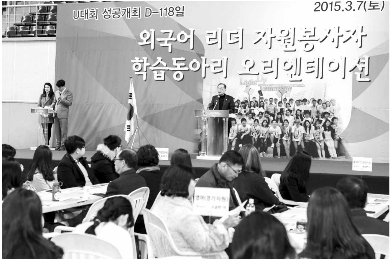
U대학 외국어 자원봉사자 오리엔테이션 광주시U대학 조직위원회는 지난 7일 광주시 서구 광양동 빛고을체육관에서 '외국어 리더자원봉사자 오리엔테이션'을 개최했다.