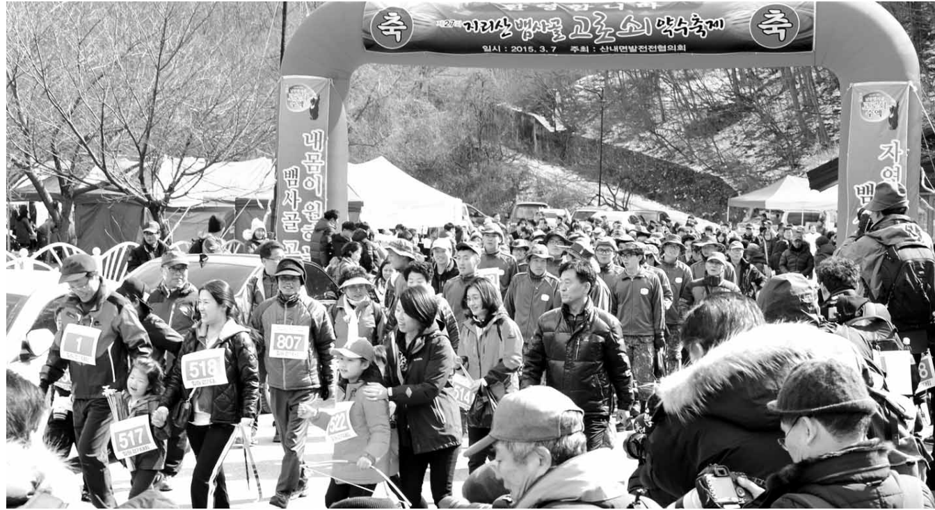
남원 '지리산 뱀사골 고로쇠 약수축제' 성황 관광객들이 지난 7일 '제27회 지리산 뱀사골 고로쇠 약수축제'를 찾아 남원시 산내면 반선주차장에서 와운마를 천년송(松)까지 왕복 5km 구간에서 힐링 걷기대회를 하고 있다.

올해 새로운 종목인 '판 페스티벌'은 1970년대 풍물에서 문화적 축제로의 패러다임 전환을 위한 상징공간으로서 지역 문화인의 참여와 공감·어울림의 참여 분위기를 조성한다.