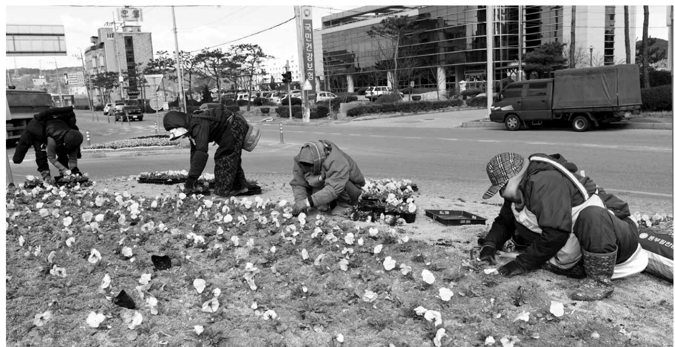
'옐로우 시티' 장성의 새봄맞이

한편 장성군은 4월 8일부터 5월 29일까지 귀농을 희망하는 도시민 및 새내기 귀농인 120여명을 대상으로 작목별 영농정착 기술교육을 실시한다. 이번 교육은 ▲시설원예 ▲과수 ▲특용작물 ▲버섯 등 4개 과정으로 나눠 총 24회에 걸쳐 진행된다. 문의(장성군 농업기술센터 061-390-8431~3) /장성=김용호기자 yongho@