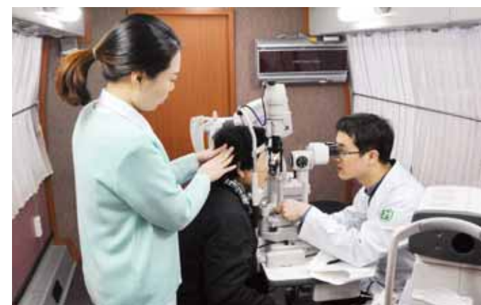
화순전남대병원(원장 조용범)과 국민건강보험 광주지역본부(본부장 김백수)가 최근 여수 금오도에서 ‘사랑 실은 건강천사’ 의료서비스를 제공했다.