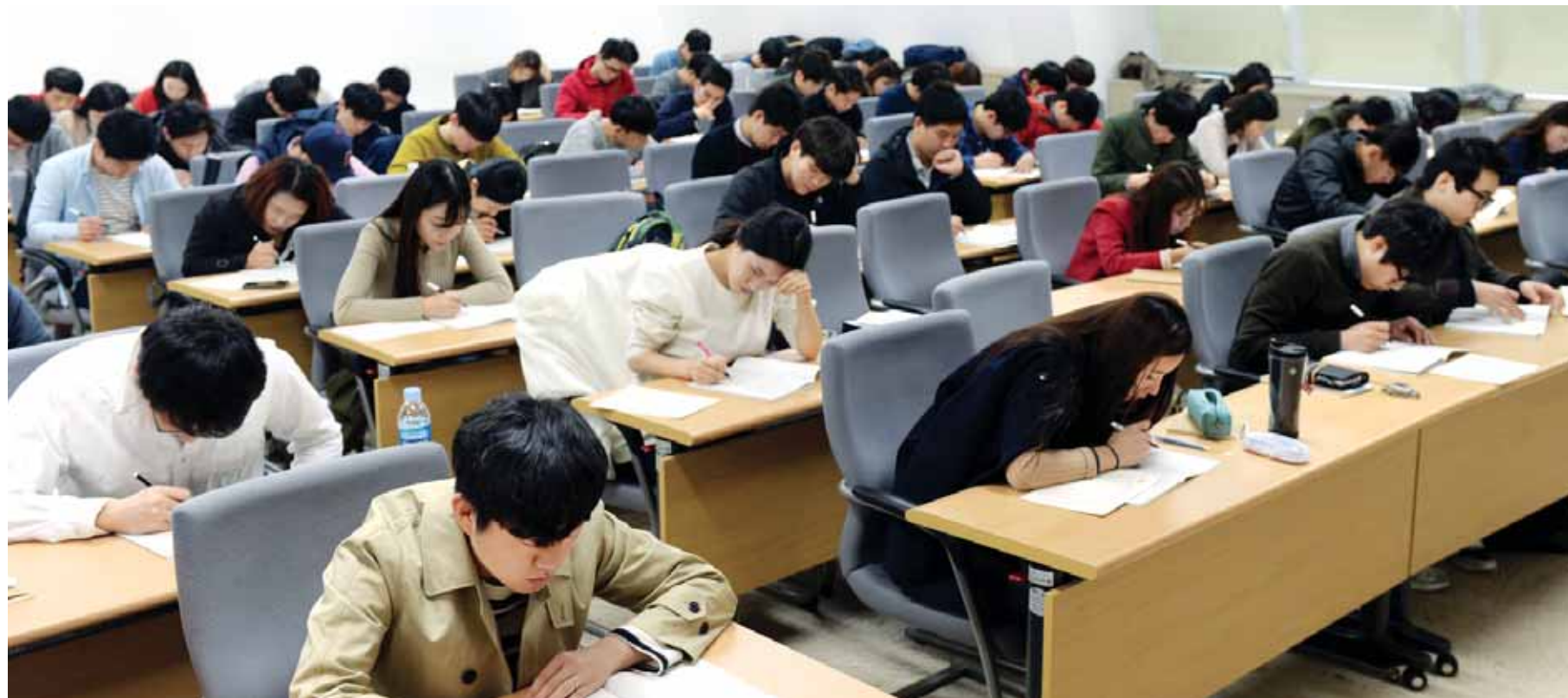
마지막 '삼성고시' D-20

23일 오후 취업준비생 150명이 조선대학교가 주최한 '2015학년도 상반기 취업대비 1차 SSAT 모의테스트'에 응시하고 있다. 삼성그룹에 취업하기 위한 첫 관문인 SSAT(삼성직무적성검사)는 오는 4월 12일 실시된다.