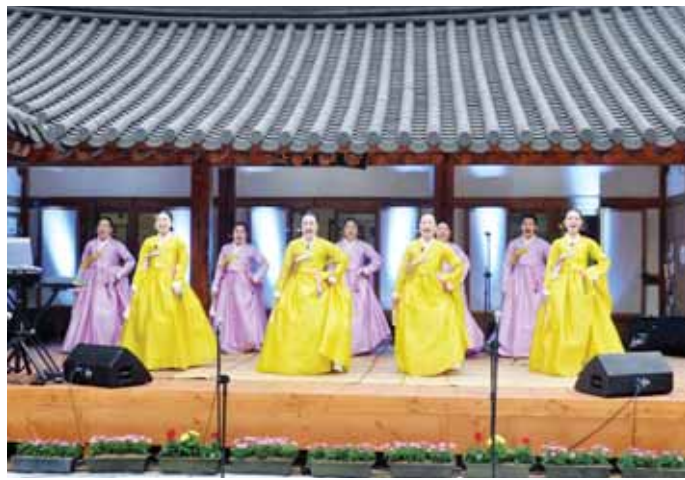
한옥골방에서 열린 국악공연