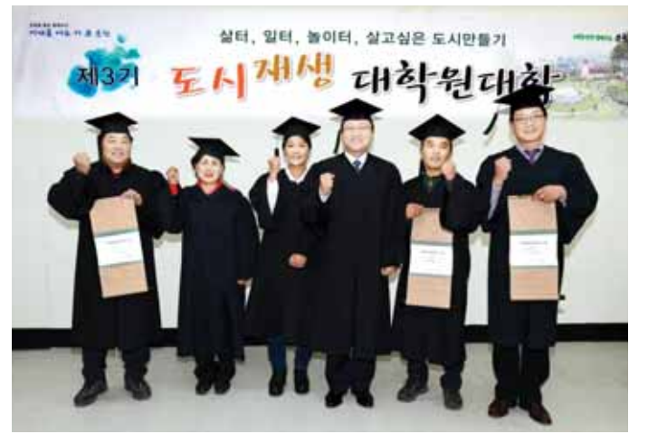
제3기 '도시재생 대학원대학' 수료식