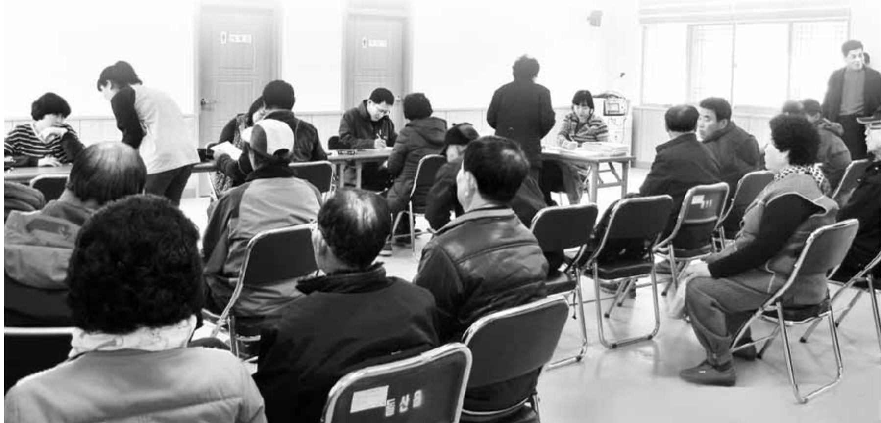
농산물품질관리원 전남지원은 농업경영체 등록 확대를 위해 조사원이 방문해 직불금 신청 업무를 지원하고 있다. 지난 17일 여수 현장 접수 현장.