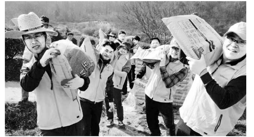
농협전남지역본부부는 농촌인력난 해소를 위한 '농촌인력중개사업'을 추진한다. 지난해 화순지역 자원봉사자들의 인력봉사 모습.