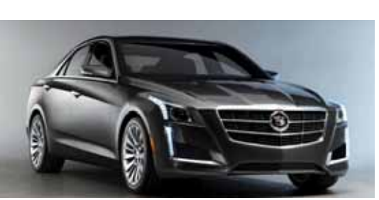
2015년형 캐딜락 CTS 세단

세계최대 자동차 기업 제너럴모터스 캐딜락 광주전시장이 개장한다. 1908년 설립된 세계 최대의 자동차 기업 제너럴모터스사 한국법인 GM 코리아 (주)정우모터스(대표 채희중)는 27일 오후 4시 광주시 서구 화정동 고원공제회관 맞은편에 1000㎡ 규모의 전시장을 마련하고 영업에 들어간다. 정우모터스 광주전시장은 정통 아메리칸 럭셔리 프리미엄 브랜드 캐딜락(Cadillac)의 다양한 모델과 컴팩트 고성능 스포츠세단, SUV까지 다양한 라인업을 선보이고 호남지역을 공략한다.