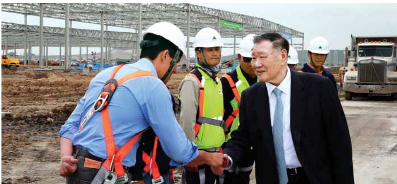
정몽구 현대차그룹 회장은 26일(한국시간) 멕시코 누에보 레온주 몬테레이의 기아자동차 멕시코 공장 건설 현장을 방문, 공장 건설 현황을 점검하고 현지 임직원들과 근로자들을 격려했다.

정몽구 현대차그룹 회장이 미국에 이어 기아차 멕시코 공장 건설 현장을 처음 방문하고, 멕시코를 비롯한 중남미 시장 본격 공략 접점에 나섰다. 정 회장은 26일 멕시코 누에보 레온주 몬테레이 인근 페스케리아 지역의 기아차 멕시코 공장 건설 현장을 찾아 공장 건설 현황을 둘러보며 중남미 자동차 시장 현황 및 현지 판매·마케팅 전략을 들었다. 정 회장은 이 자리에서 "글로벌 최고 수준의 경쟁력을 갖춘 공장을 건설해 멕시코를 비롯한 중남미 시장 공략은 물론, 북미 시장 공세를 위한 새로운 교두보 확보에 만전을 기해달라"고 말했다. 기아차는 30만대 규모의 멕시코 공장이 완공되면 국내 169만대, 해외 168만대, 총 337만대의 글로벌 생산 능력을 갖추게 된다. 기아차는 지난 8월 레온주 정부와 현지 공장 건설을 위한 투자계약을 체결하고, 같은 해 10월 착공에 들어갔다. 내년 상반기엔 공장이 본격 가동된다. 멕시코 공장에서는 기아차의 글로벌 베스트셀링카인 'K3'가 생산될 예정이며 소형차급 현지 맞춤형 전략차도 개발해 선보일 계획이다. /임동률기자exian@kwangju.co.kr