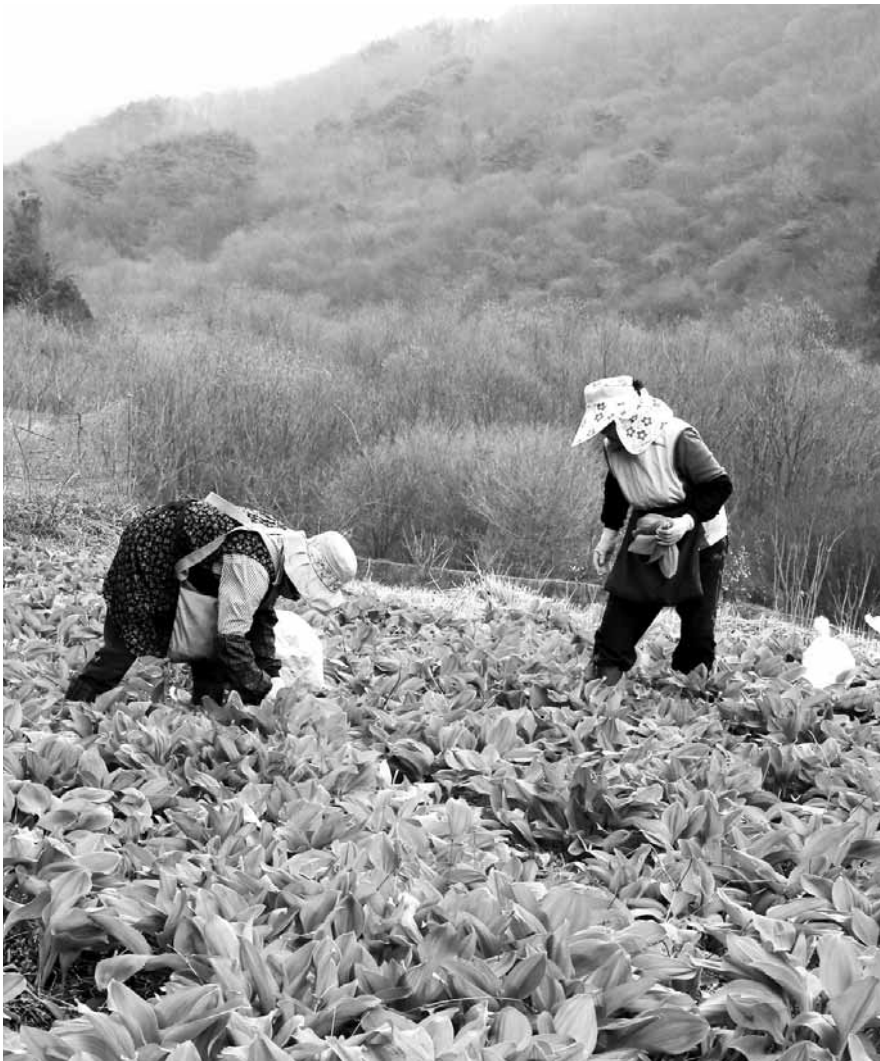
지리산 '황제나물' 명이 수확

한편 지리적표시 제도는 특정 지역의 우수 농산품과 그 가공품에 지역명 표기를 할 수 있도록 해 생산자와 소비자 보호를 목표로 하고 있다. 그 지역에서 생산·제조·가공됐음을 독점적으로 표시할 수 있도록 해 법률에 따라 지적재산으로 보호하는 제도이다. /고흥=주각중기자 gju@