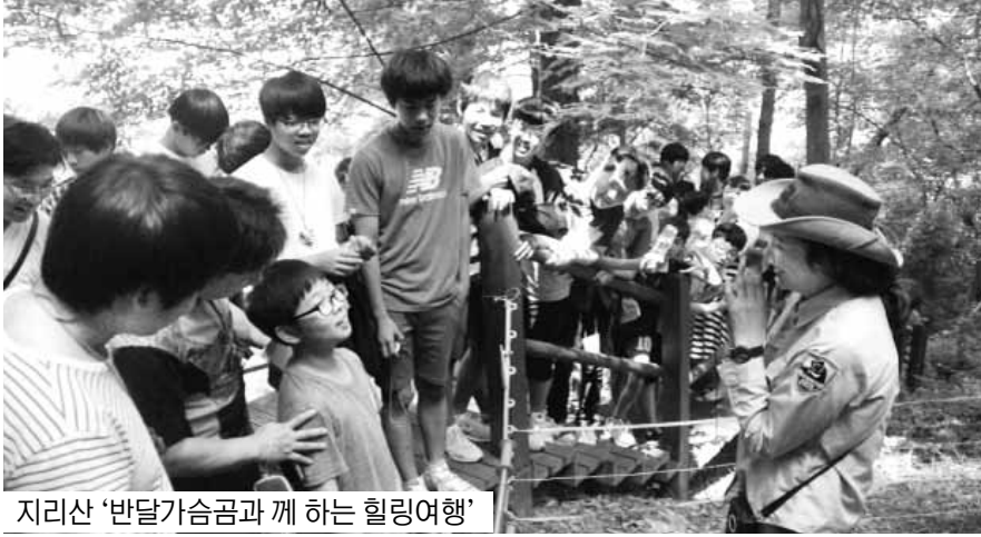
지리산 '반달가슴곰과 깨 하는 힐링여행'