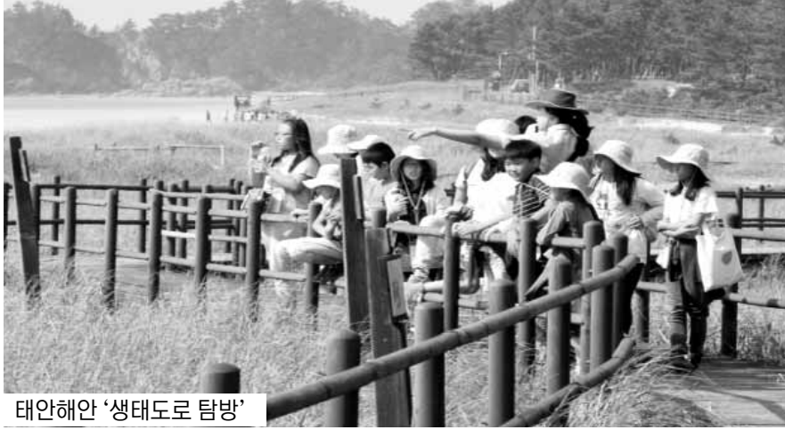
태안해안 '생태도로 탐방'