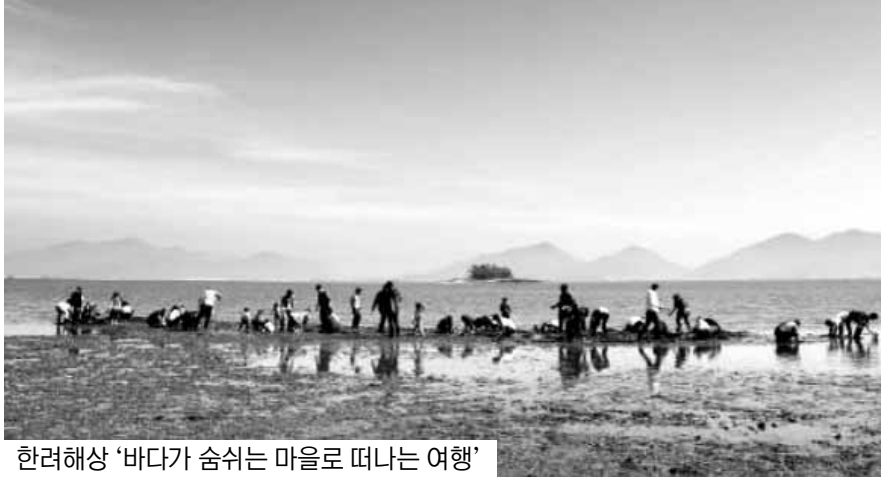
한려해상 '바다가 숨쉬는 마을로 떠나는 여행'