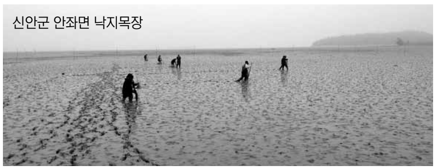
신안군 안좌면 낙지목장 목장을 조성했는데, 당시 교점된 어미 낙지 45마리를 방류한 결과, 2012년 어획량(2만2000마리)보다 16%가량 증가한 2만5600마리의 낙지가 잡혔다.

앞서 전남도 해양수산과학원은 2013년 처음으로 신안군 장산면 갯벌 1ha에 낙지