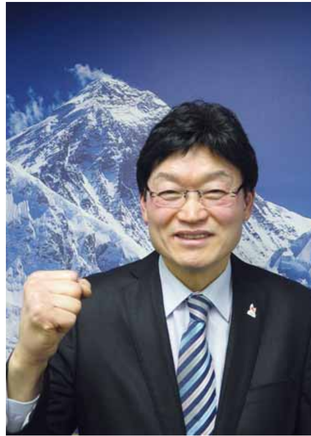
때마다 산에 다니며 생각을 정리한다. 그런 점에서 산은 내 인생에서 각별한 의미로 다가온다”고 강조했다.