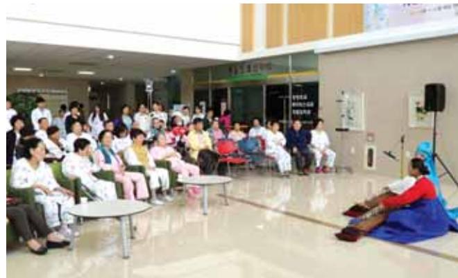
류마티스 및 퇴행성관절염 전문질환센터인 빛고을전남대학교병원이 최근 환자를 위한 쾌유 음악회를 열어 큰 호응을 얻었다.