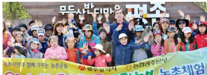
11일 도시가족 주말농부행사에 참여한 초등학생들이 체험행사가 열린 무등산 평촌명품마을 앞에서 기념촬영을 하며 활짝 웃고 있다. <농협 광주지역본부 제공>

주광역시청홈페이지(www.gwangju.go.kr), 식사사랑농사운동 홈페이지(www.식사사랑농사.com)에서 모집한다. 참가비는 1인당 1만원이다. <김대성기자 bigkim@kwangju.co.kr>