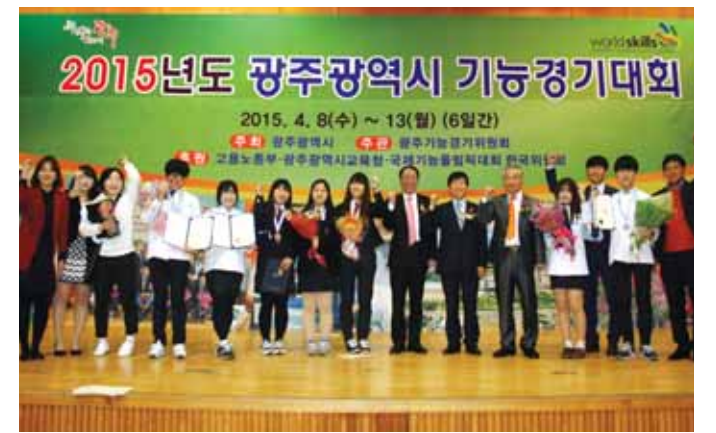
광주시와 광주시기능경기위원회(한국산업인력공단 광주지역본부)가 13일 광주공업고 체육관에서 올해 광주시 기능대회 입상자 129명에 대해 시상식을 열었다.