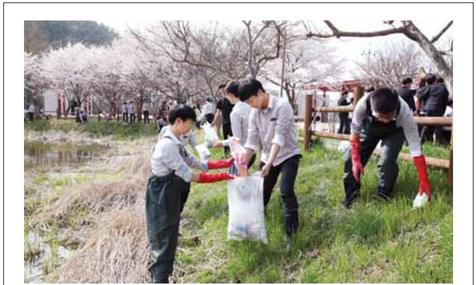
광주대동고 학생들이 지난 10일 학교 앞에 있는 전평제호수에서 쓰레기를 줍고 있다.

박 시장은 진도 출생으로 목포고등학교와 조선대 법학과를 졸업하고 한양대학교에서 법학석사 학위를 취득했다. 1980년 공직에 입문한 이래 제16대 대통령직인수위원회 전문위원과 세종연구소 연구위원 등 30년간 국가공무원으로서 근무했으며 조선대학교 객원교수를 거쳐 2014년 목포시장에 당선됐다. /목포=김준석기자 kjs0533@